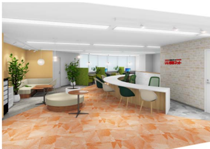
オープン100店舗目のFC加盟店「いい部屋ネット 天神店」（福岡県福岡市）内観イメージパース <いい部屋ネット 天神店 概要>

所在地：福岡県福岡市中央区天神3丁目3-6 天神サンビル 7F 電話：0800-222-6880（通話料無料） WEBサイト： https://www.eheya.net/shop/fc00108/