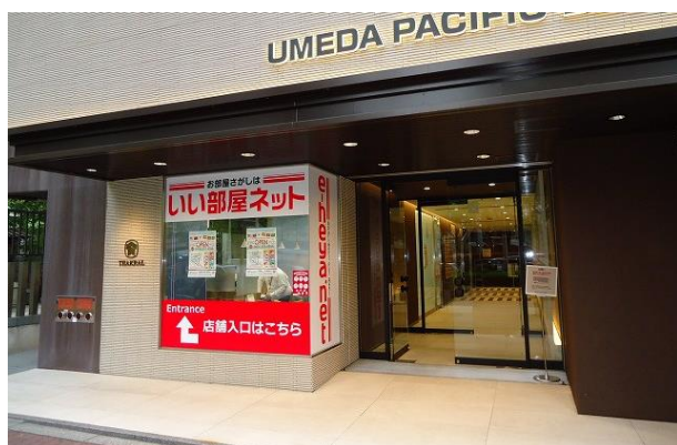
インターナショナル大阪店／外観