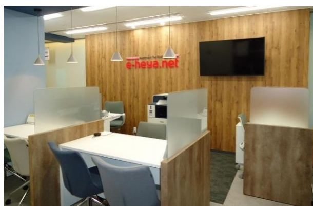
インターナショナル大阪店／内観