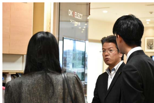
ショールームを見学しながら、内定者や保護者から質問を受ける先輩社員