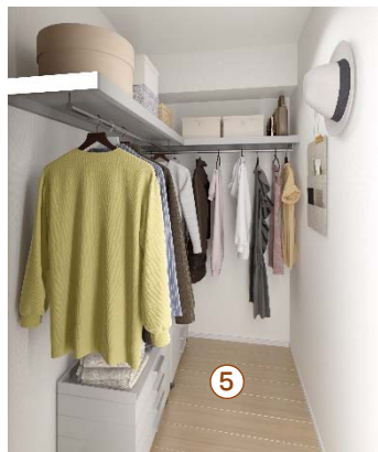
⑤ ウォークインクローゼット 広々とした収納スペースを確保できます。