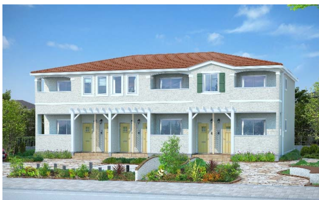
外観イメージ:6戸タイプ(南入)

また、外観は瓦風の屋根や明るい色調の窓飾り、パーゴラ風ポーチを設けて、ヨーロッパ風のデザインとしています。