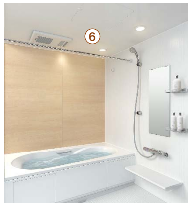
⑥ アクセント照明 広々としたバスルームを心地良い空間に演出します。