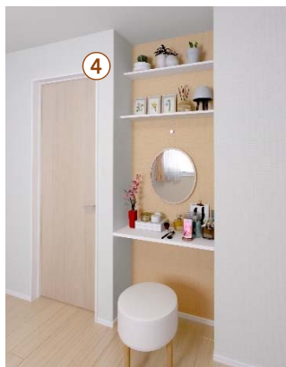
④ ドレッサーカウンター オシャレを楽しむ女性に嬉しいアイテムです。

洋室は、女性に嬉しい「ドレッサーカウンター」や「ウォークインクローゼット」を設置し、オシャレを楽しめる空間となっています。