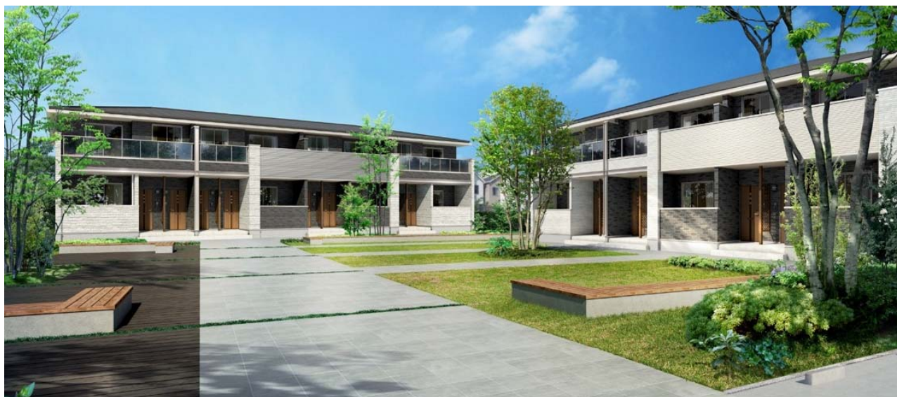
左:4戸並(南入)、右:3戸並(南入)