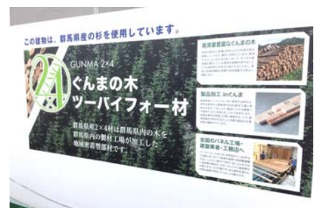
仮囲いのラッピングイメージ

※1 仮囲い:工事現場内外の安全確保のため、一定期間(3カ月～1年程度)現場周囲に設ける囲いのこと