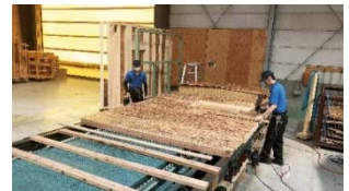
県内JAS認定工場での製材