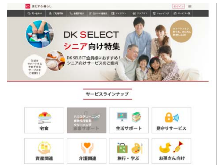
ウェブサイト利用イメージ