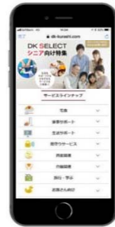
アプリ利用イメージ