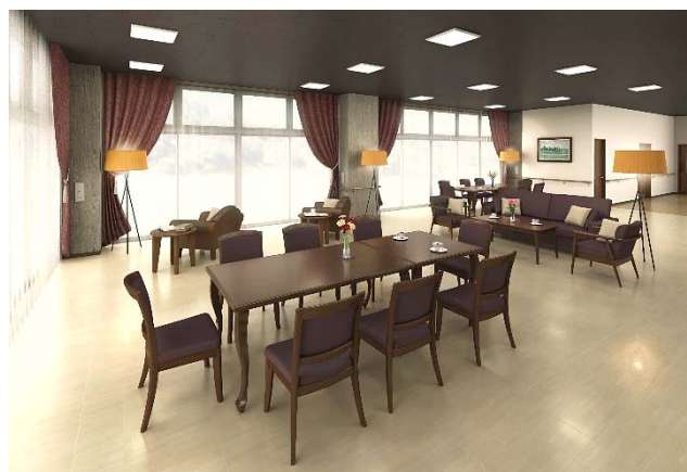
&lt;コミュニティラウンジ(イメージ)&gt;